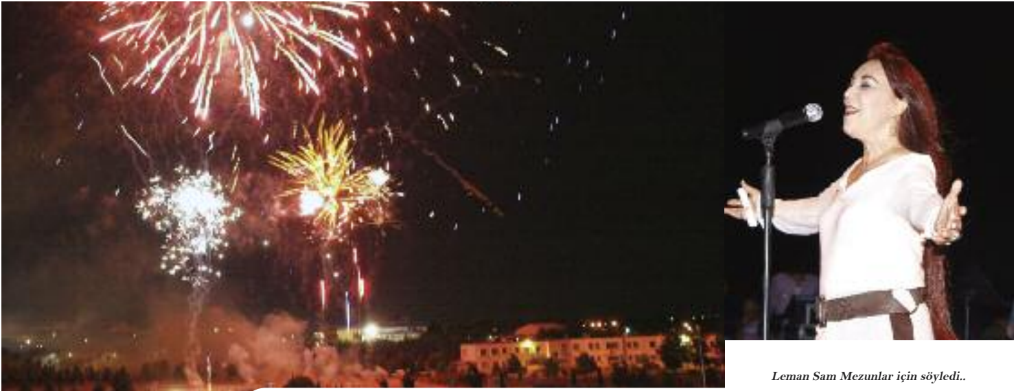
Leman Sam Mezunlar için söyledi.