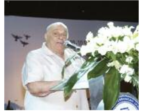
KKTC Kurucu Cumhurbaşkanı Rauf Raif Denktaş öğrencilere seslenirken...

Öztoprak mezunlardan DAÜ'yle bağlarını koparmalarını, hangi ülke ve hangi görevde olurlarsa olsunlar DAÜ'yü sahiplenmelerini isteyerek, “Üniversitemiz desteğinizle geliştikçe sizlerin de itibarımız artarak gelişecektir” dedi.