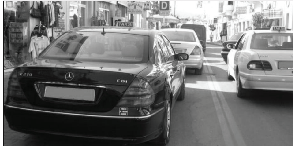
Gazimağusalı taksiciler kentte elliden fazla aracın korsan çalıştığını iddia ediyor.

söylüyorlar. Ayrıca, ticari taksicilik ve taşımacılık konusunda da tedbir alınmasını istiyorlar. Müşterilere daha iyi hizmet verebilmeleri ve haklarının sömürülmemesi için bunların şart olduğunu söylüyorlar.