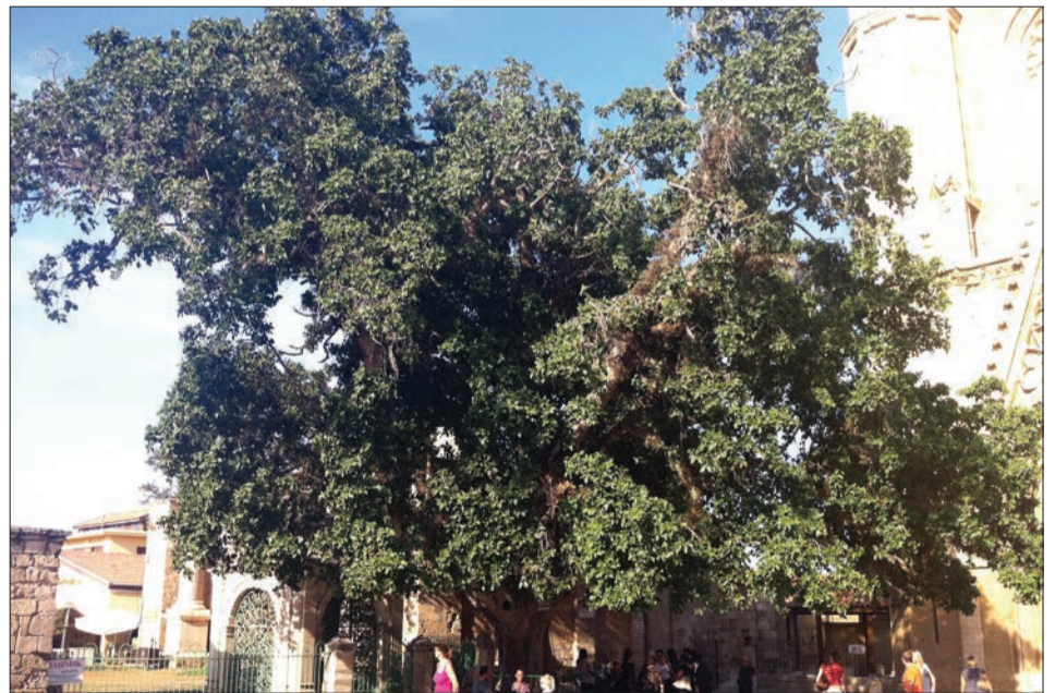
Gazimağusa Suriçi'nde bulunan cümbez ağacının 680 yaşında olduğu tahmin ediliyor.

İngilizlerin yaptığı bir diğer uygulama ise, insanların üzerine bakabilecekleri oranda ağaç tapu edilmesi. Köylüler, bakımını üstlendikleri bu ağaçlardan ticari anlamda fayda sağlayabiliyorlarmış. Bu ağaçlar, başkasının tarlasında dahi olsa, tarla sahibi o ağaç üzerinde söz sahibi değilmiş. Direk, bunu 'inanılmaz bir sistem olarak' niteliyor ve ekliyor: "Sömürgecilikten kimse haz etmez ancak Biz İngilizlerin devlet olarak çok gerisindeyiz."