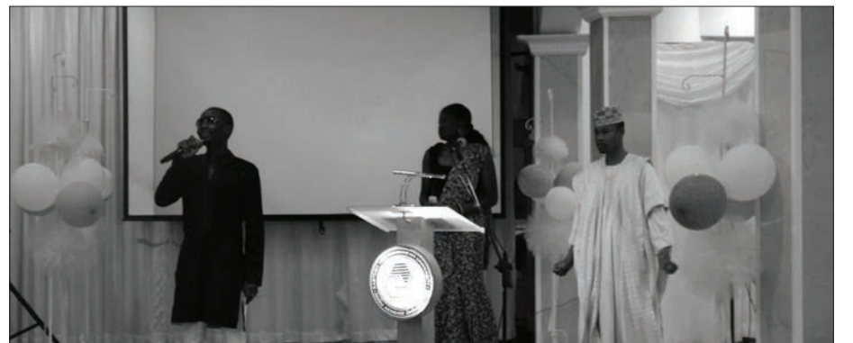
Nijerya Öğrenci Birliği ve Uluslararası Merkez tarafından düzenlenen etkinlikler gün boyu sürdü.