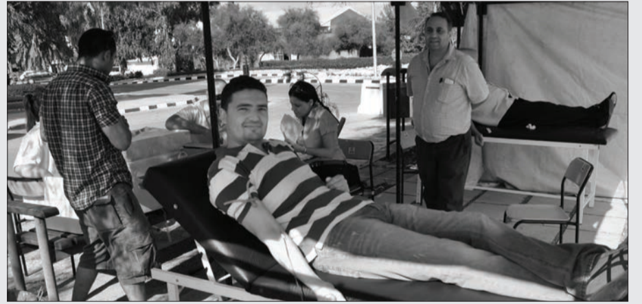
Kanın saklanma süresi bir ay olduğu için bağıışların sürekli olması önem taşıyor.

Kampanya boyunca kan bağıışında bulunan duyarlı kişilere de teşekkür belgesi verildi.