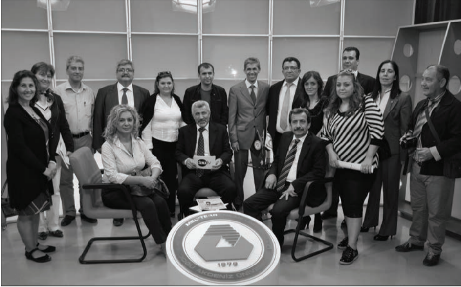
Mersin'den gelen gazeteci heyeti, DAÜ TV stüdyoları, Radyo Doğu Akdeniz, Medya Takip Merkezi ile Sualtı Araştırmaları ve Görüntüleme Merkezi'nde incelemelerde bulundu.