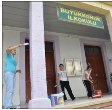
Büyükkonuk İlkokulu öğrenciler tarafından boyandı.

Bu akademik yıldaki ilk sosyal sorumluluk projesi olan "okullar renkleniyor" projesi çerçevesinde 3 gün süren çalışma ile Büyükkonuk İlkokulu baştan sona boyandı ve geleneksel Eko