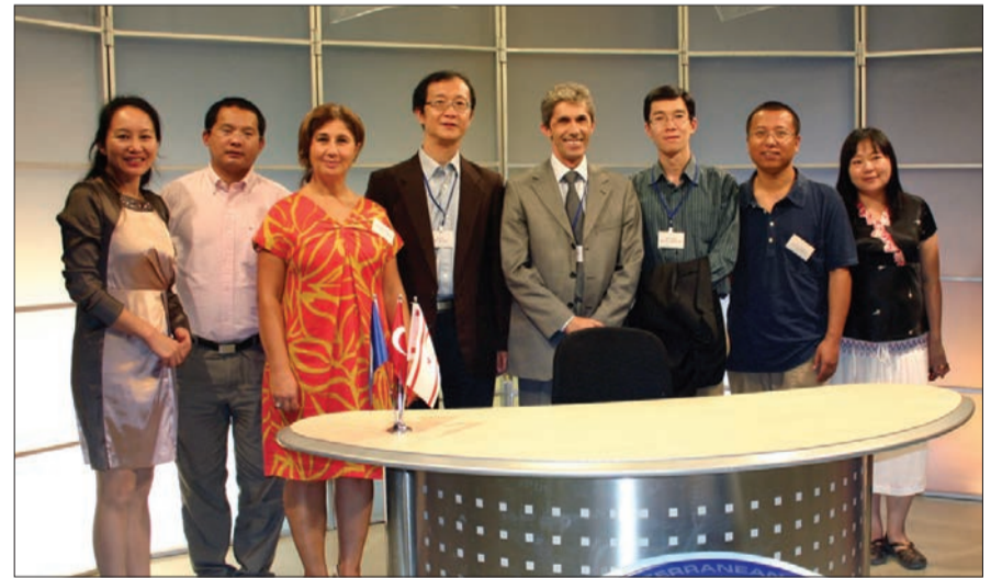
Çin'in önde gelen eğitim kurumlarından olan Tsinghua Üniversitesi'nden gelen akademik heyet DAÜ TV stüdyolarını gezdi.