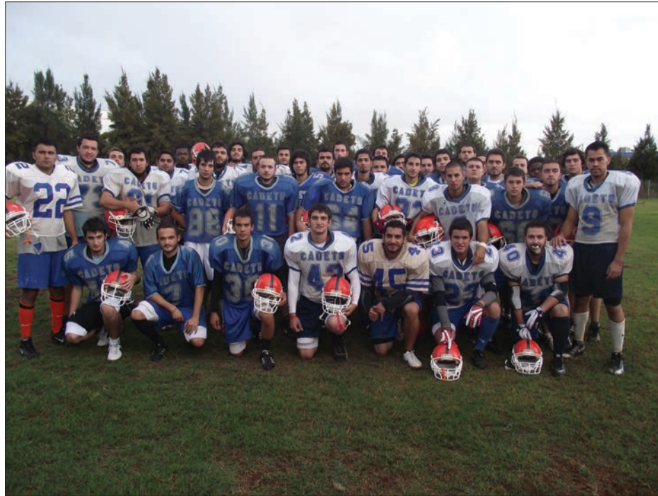
DAÜ Amerikan futbolu takımı bu yıl oynayacakları bütün maçları kazanmayı hedefliyor.