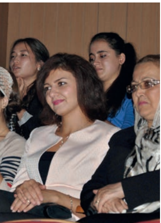
Velileri büyük ilgi gösterdi