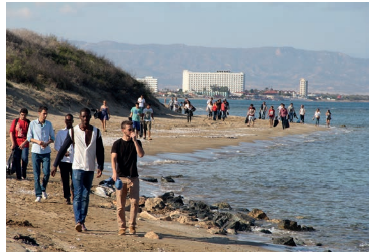
Mimarlık öğrencileri uzun bir sahil şeridini temizleyerek doğaya katkıda bulundular