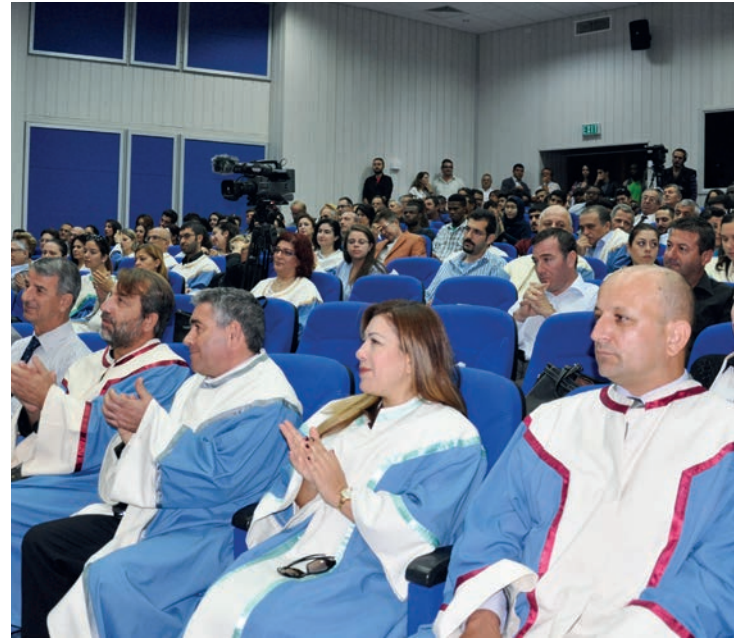
Törene akademik personel ile öğrenciler katıldı