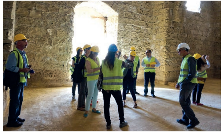
DAÜ'lü iç mimarlar Othello Kalesi'ni incelediler