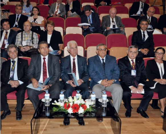
Sempozyuma katılanlar konuşmaları ilgi ile dinledi