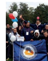
DAÜ Rusya'da Temsil Edildi