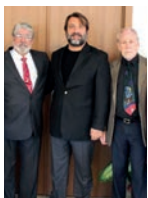
İletişim Fakültesi Akreditasyon Sürecinde