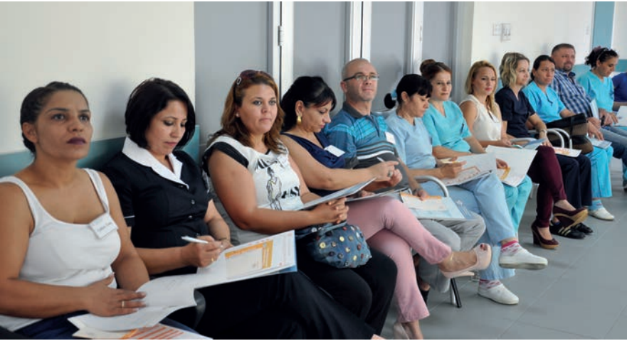
Gazimağusa Devlet Hastanesi personeli eğitimi ilgi ile izledi

olacağına inandığını sözlerine ekledi. Katılımcılar yapılan bu çalışmanın yaşamlarına ışık tutarak daha olumlu düşüncelerini sağladığını ifade ettiler. Çözüm odaklı ve yüksek motivasyonla yaklaşılacak olayların daha olumlu sonuçlar yaratarak kişisel, profesyonel ve kurumsal gelişimlerine büyük katkılar sağladığını dile getiren katılımcılar, memnuniyetlerini de ifade ettiler.