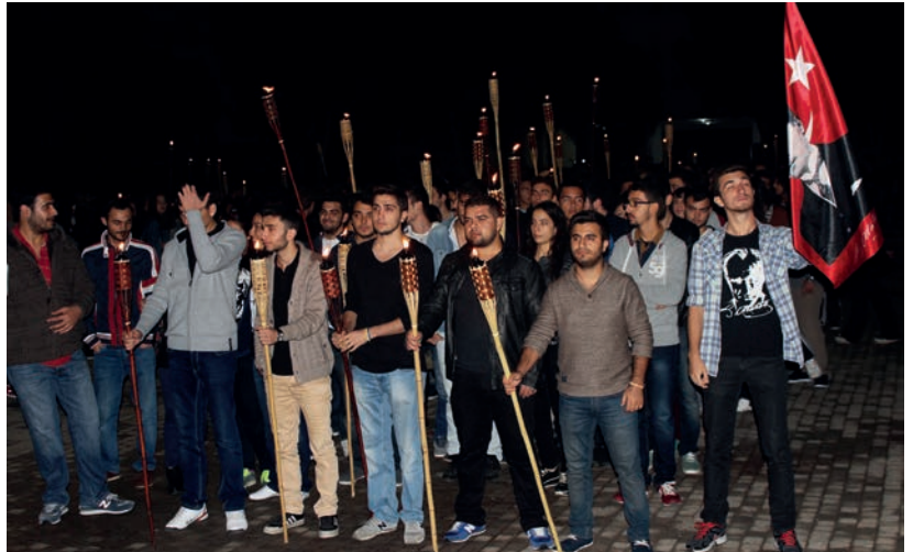
Cumhuriyet DAÜ öğrencileri tarafından da coşkuyla kutlandı

İstiklal Marşı'nı okuyan öğrenciler, Cumhuriyet'i ilelebet koruyacaklarına dair söz verdiler.