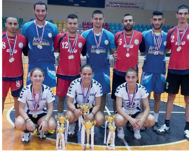
Turnuvada ödül alan DAÜ'lü sporcular birarada

Dünya Futbol tenisi turnuvasının önümüzdeki günlerde KKTC'de yapılacak olmasından dolayı milli takımın da oluşturulması adına düzenlenen turnuvada DAÜ kadınlar ve erkeklerde tüm kategorilerde şampiyonluğa ulaşarak kırılması zor bir rekora da imza atmış oldu.