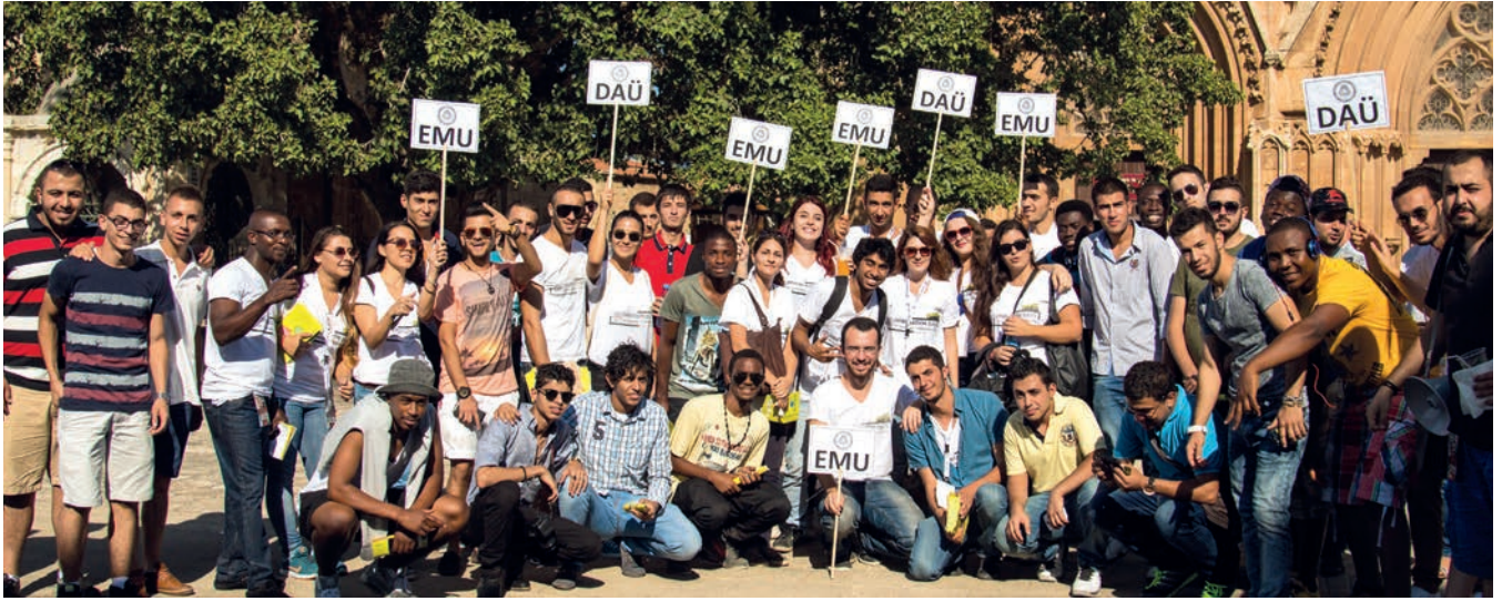
Öğrenciler Gazimağusa Lala Mustafa Paşa Camii önünde