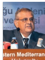
IV. Uluslararası Kıbrıs Sempozyumu Gerçekleştirildi