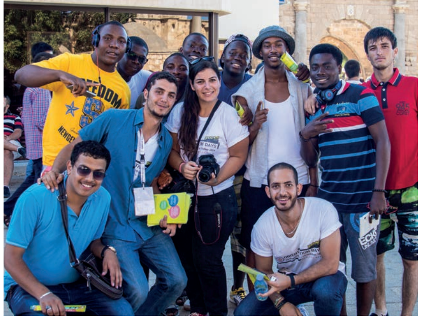
Öğrenciler Gazimağusa kentini yakından tanıma fırsatı buldular

Girne'ye hareket ederek Girne Kordon Boyu, Girne Kalesi ve Bellapais Manastırı'nı ziyaret ettiler. 12 Ekim 2014 Pazar günü ise Kapraz bölgesini ziyaret eden öğrenciler Dipkarpaz köyü ve Apostolos Andreas Manastırı'nı yakından görme fırsatı yakaladılar. Yaklaşık 1000 öğrenci ile gerçekleştirilen söz konusu ziyaretler sonunda öğrenciler ve velileri hem DAÜ'ye hem de KKTC'ye hayran kaldıklarını ve DAÜ'yü tercih etmekten dolayı son derece memnun olduklarını dile getirdiler.