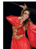
Yeni Öğrencileri ve Aileleri İçin "Hosgeldiniz Festivali" Düzenlendi