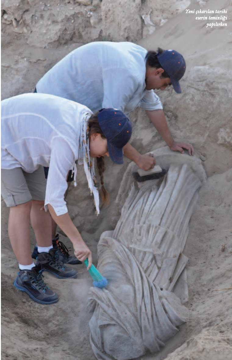
Yeni çıkarılan tarihi eserin temizliği yapılırken