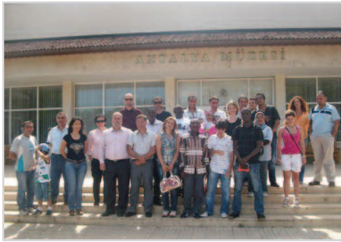
Sualtı Eğitimi Programı katılımcıları birarada