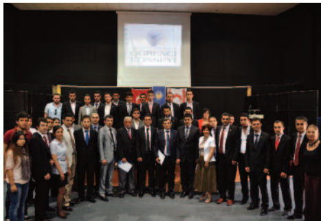
Toplantı katılımcıları Rektörlük yetkilileri ile birarada