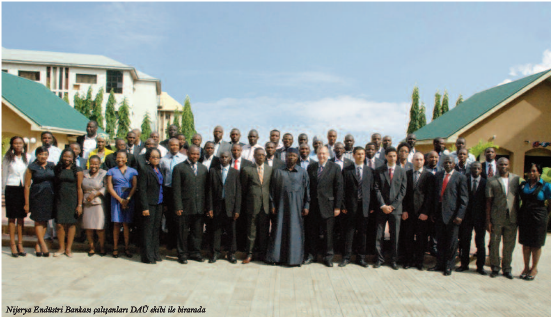
Nijerya Endüstri Bankası çalışanları DAÜ ekibi ile birarada