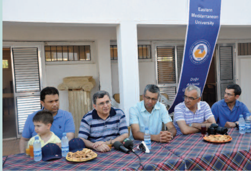
Basın mensuplarına Salmis Kazı Evi'nde tarihi eserler hakkında bilgi verildi