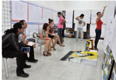
Mezun adayları Bitirme Projelerini heyecan içinde sundular