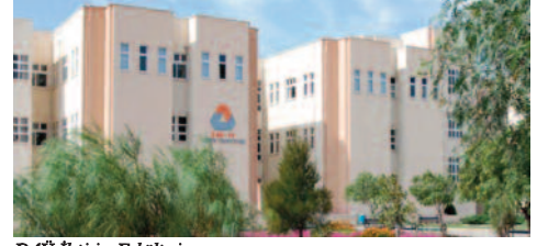
DAÜ İletişim Fakültesi

Doğu Akdeniz Üniversitesi (DAÜ) İletişim Fakültesi'nde İngilizce programların yanı sıra iki alanda Türkçe programlar açılıyor. DAÜ Üniversite Senatosu'nda kabul edildikten sonra KKTC Yükseköğretim Planlama, Denetleme, Akreditasyon ve Koordinasyon Kurulu (YÖDAK) ile TC Yükseköğretim Kurulu (YÖK) onayı olarak 2011-2012 eğitim-öğretim yılından itibaren öğrenci kabul etmeye başlayacak olan Gazetecilik ile Radyo-TV ve Sinema programlarının bu alanlarda Türkçe eğitim görmek isteyenler için birer cazibe merkezi olacağı öngörüldü.