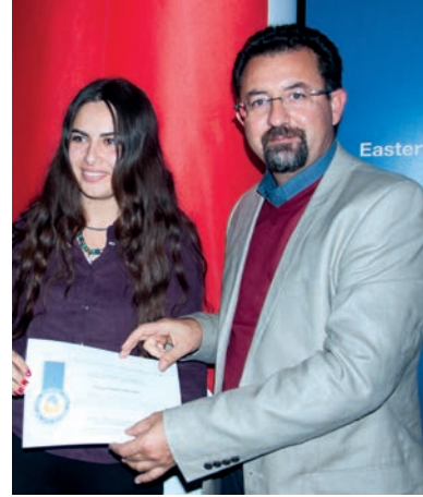
2. Moleküler Biyoloji ve Genetik Kariyer Günü'nde öğrencilere şeref ve yüksek şeref belgeleri de takdim edildi