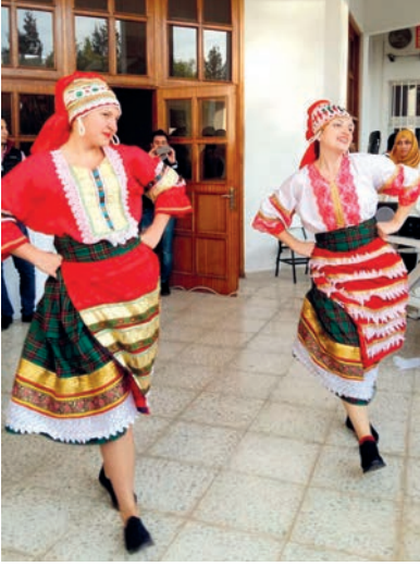
Etkinlik danslarla renklendi

farklı lezzetleri tadan bölüm öğrencileri ve öğretim üyeleri, farklı kültürlerden derlenen şarkılarla keyifli saatler geçirdiler. 20'den fazla farklı ülkeden gelen İngiliz Dili Eğitimi Bölümü öğrencileri, hem Kıbrıs müzik ve danslarıyla, hem de kendi kültürlerine ait müzik ve danslarla yeni yıla ilk merhabalarını demiş oldular.