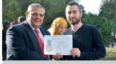
DAÜ İngiliz Dili Eğitimi Bölümü Başarılı Öğrencilerini Ödüllendirdi