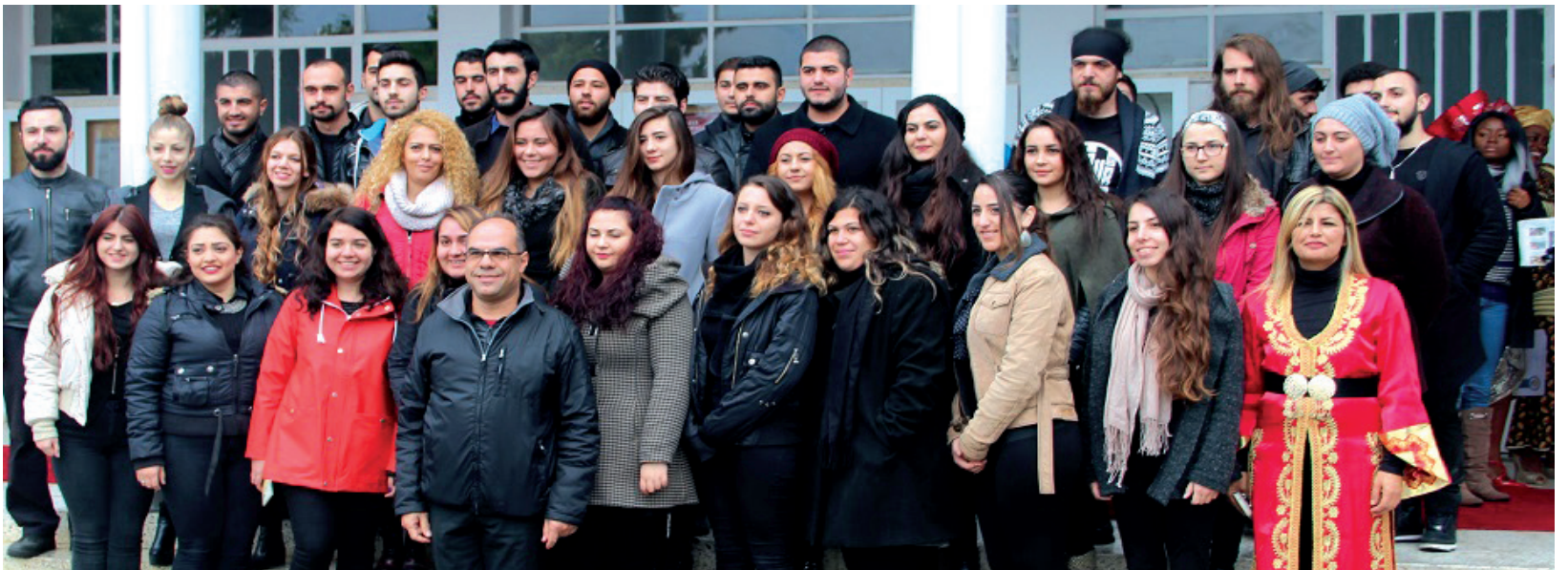
Sertifika töreni sonunda öğrenciler birarada