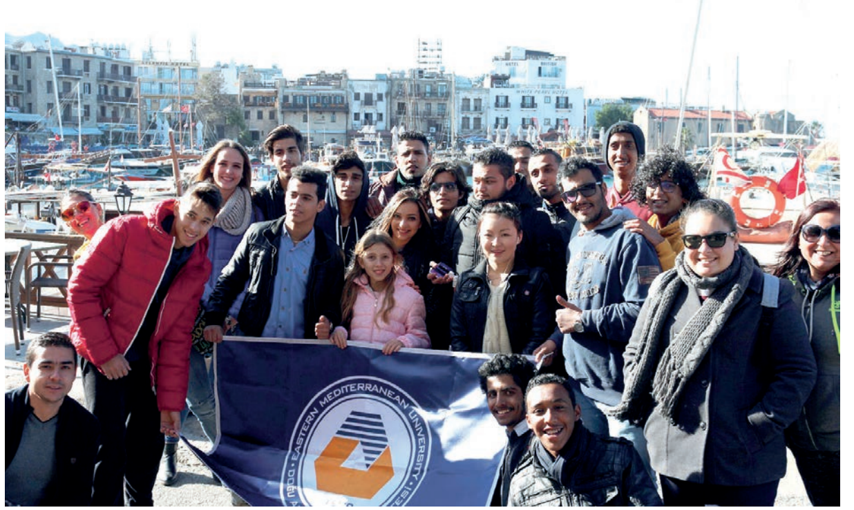
Yabancı Diller ve İngilizce Hazırlık Okulu öğrencileri Girne'de

öğrenciler Girne'nin turistik yerlerini de gezerek mutlu bir şekilde Gazimağusa'ya döndüler.