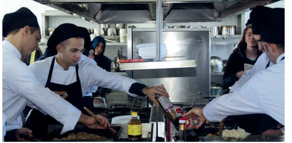
Gastronomi ve Mutfak Sanatları Bölümü atölye çalışması

Öğrenciler için çok faydalı bir organizasyon, istedikleri bölüm hakkında bire bir bilgi alma fırsatı yakalıyorlar. Öğrenciler daha kolay karar verme şansına sahip oluyorlar. Ben de bir DAÜ mezunuyum ve çok kaliteli bir öğrenci kadrosuna sahip.