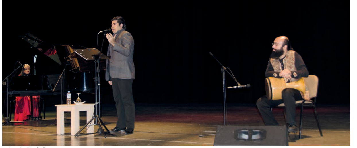
İrânlî sanatçı Salar Aghili