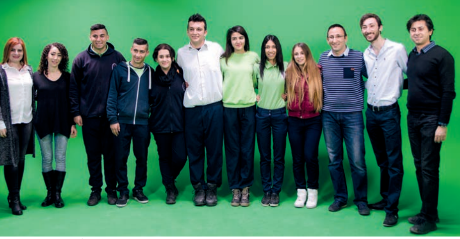
Sanatlar ve Görsel İletişim Tasarımı Bölümü atölye çalışması