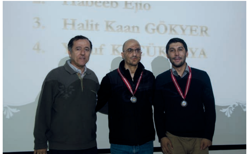
Törende yüksek şeref ve şeref sertifikaları ile yarışmalarda derece alan öğrenci ve akademisyenlere madalyaları takdim edildi