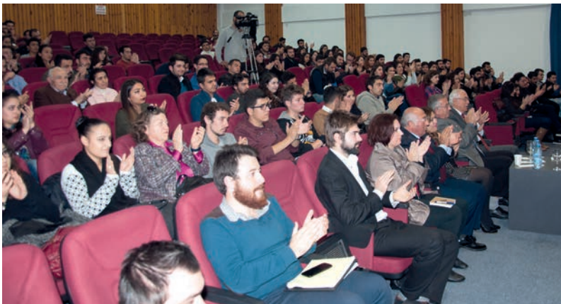
Konferansa yoğun bir katılım oldu