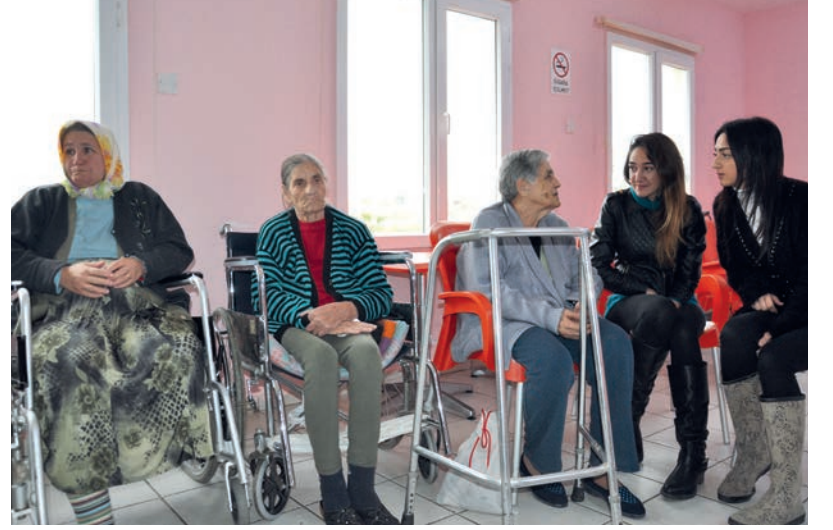
Öğrenciler site sakinleri ile bol bol sohbet etti

Ben 2 yıldır burada yaşıyorum ve günlerimiz çok güzel geçiyor. Çok güzel arkadaşlıklar kurduk. Bir aile gibi olduk burada ve ziyaretçilerin gelmesi ile çok daha mutlu oluyoruz.