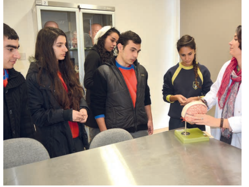
Tıp Fakültesi atölye çalışması