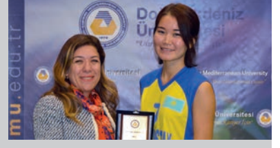
"Cup Of Nation Basketball" Turnuvası Tamamlandı