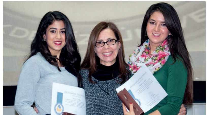
Öğrenciler sertifikalarını fakülte öğretim görevlilerinden aldı