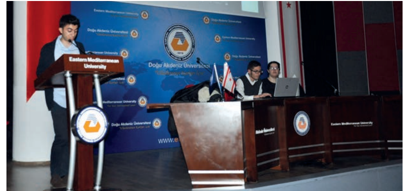
Film gösterimlerinden önce öğrenciler çevirileri hakkında sunum yaptılar