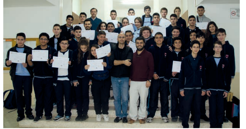
Kursa katılan öğrenciler ve kurs veren öğretim görevlileri birarada