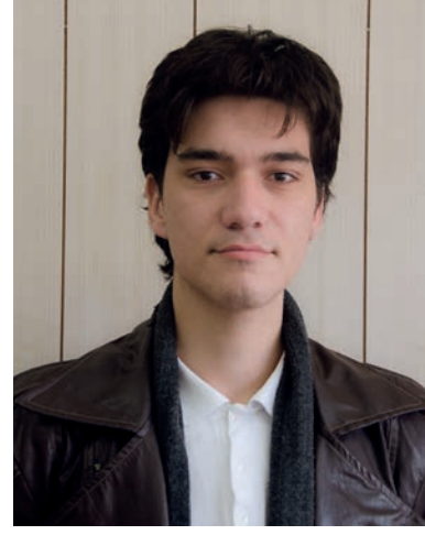
İsmet Taluk Anafartalar Lisesi Son Sınıf Öğrencisi

Bizler için çok faydalı bir gün. Özellikle karar vermede zorlanan öğrenciler için atölye çalışmaları çok yararlı oluyor. Bugün hocalar bizlerle çok ilgilendi ve DAÜ en iyi üniversiteler arasında yer alıyor, bu yüzden ilk tercihim kesinlikle DAÜ'dür.