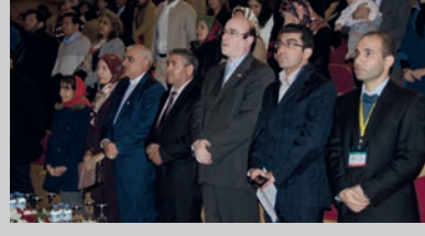
DAÜ'de İran Yalda Gecesi Gerçekleştirildi