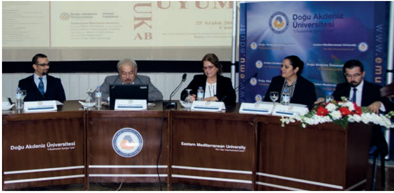
İkinci oturumdan bir kare