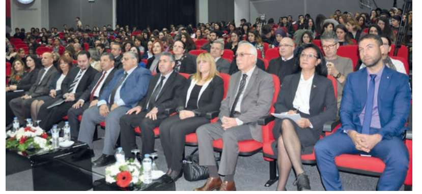
Panelde yoğun bir katılım oldu