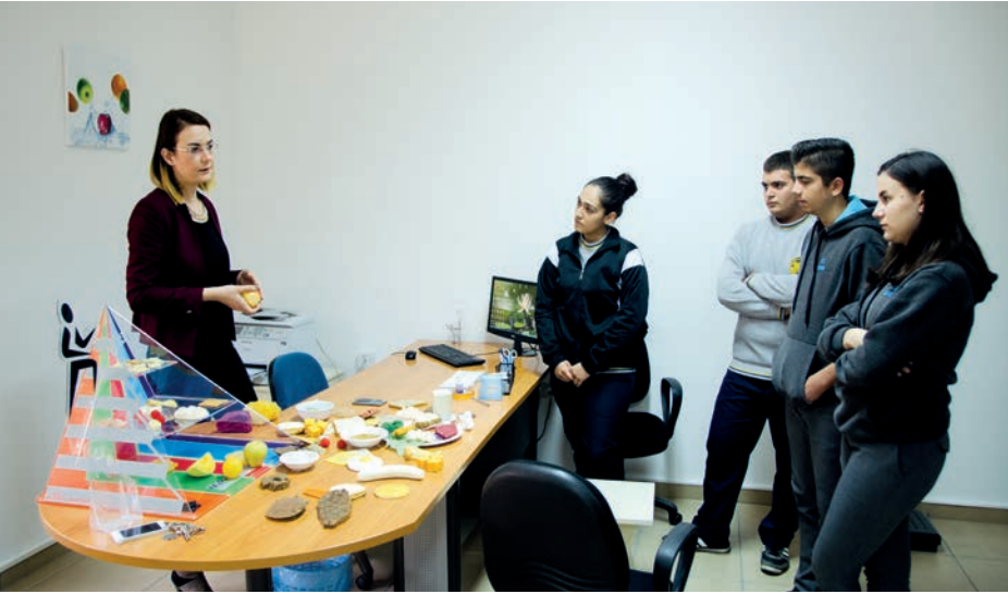
Diyet ve Beslenme ve Diyetetik Bölümü atölye çalışması