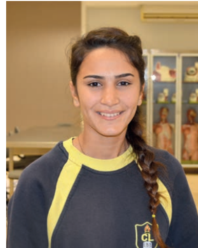
Buse Fidan Cumhuriyet Lisesi Son Sınıf Öğrencisi

Ben Eczacılık alanında eğitim almak istiyorum. DAÜ tercihlerim arasında olan bir üniversite. Uluslararası olması ve İngilizce dilinde eğitim vermesi çok güzel. DAÜ'de birbirinden farklı kültürler bir arada eğitim alıyorlar. Eğitim kalitesi açısından da KKTC'de en iyi üniversite olduğunu biliyorum. Atölye çalışması sayesinde de ileride eğitim almayı düşündüğüm bölüm hakkında detaylı bilgi sahibi oldum.